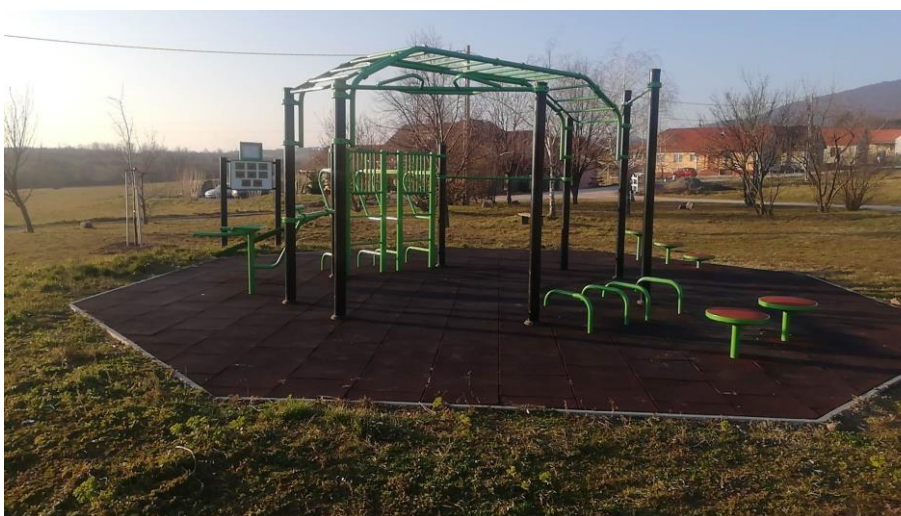
Edzőpálya a tó mellett