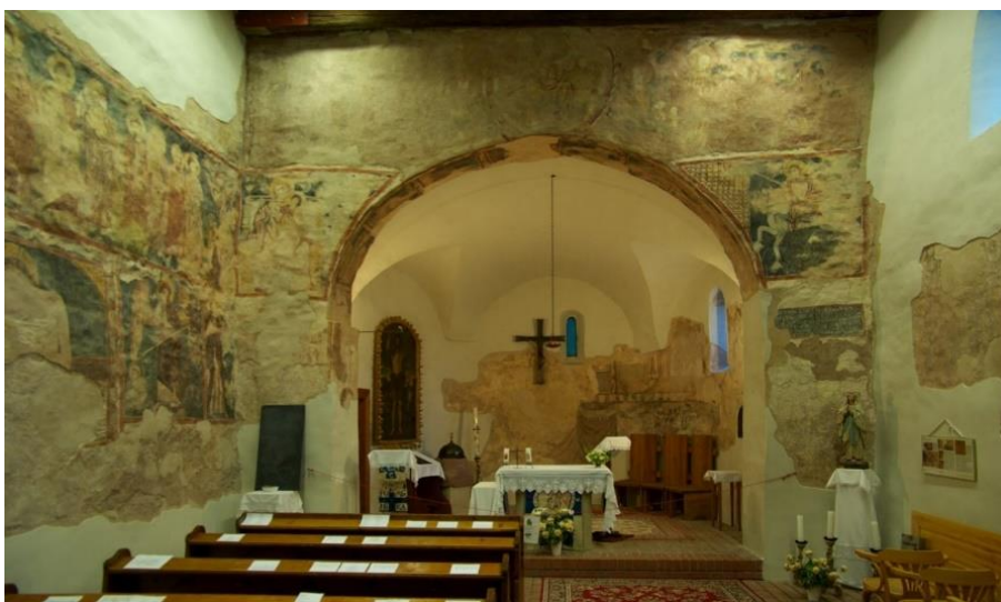
A Cserkúti Keresztelő Szent János-templom belsőtér