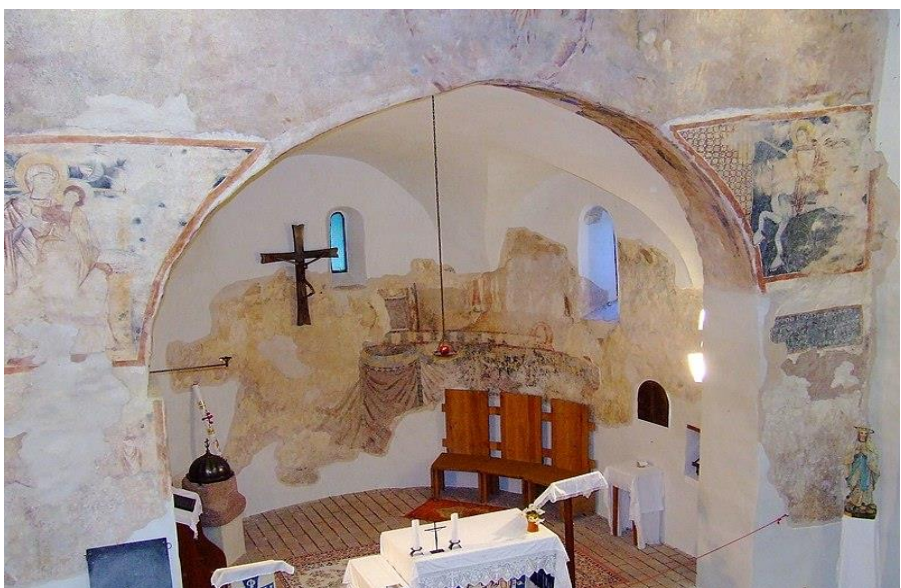
A cserkúti középkori templom szentélye