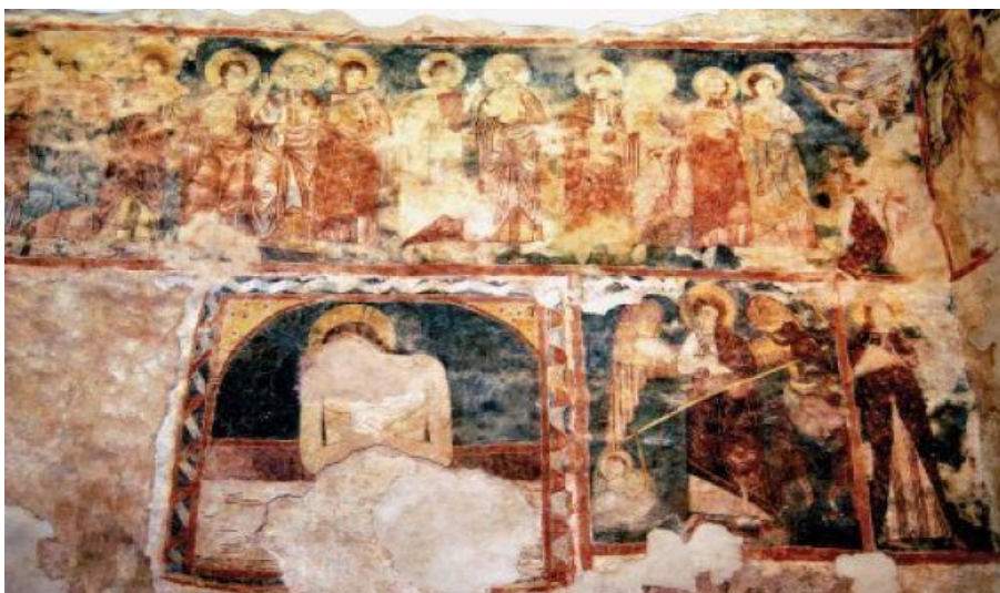
Freskó a cserkúti középkori templom északi falán